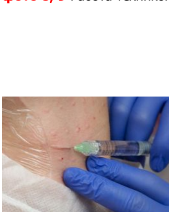
фото 8, 9 Работа техникой КИД на шее

В рамках техники, игла вводится, как «заноза под кожу», постепенно отсепаровывая эпидермис и разрушая метаболический инертный collagen в глубине морщины-линии, затем ретроградно выводится туннель из препарата для обеспечения максимальной реструктуризации и регенерации кожи в этой зоне.